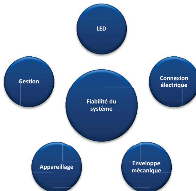
Figure 1 : la durée de vie du luminaire dépend de la fiabilité du système

Remarque : si un luminaire LED est équipé d'un module LED remplaçable, la durée de vie du luminaire peut être dissociée de la durée de vie du module LED. Cela rapproche la définition de durée de vie d'un luminaire de la définition actuelle de la durée de vie d'un luminaire conçu pour des sources de lumière conventionnelles. Par exemple, des luminaires d'éclairage routier durent souvent 30 à 40 ans, toutefois, il est en effet préférable de publier la durée de vie du module LED comme étant la durée de vie du luminaire LED.